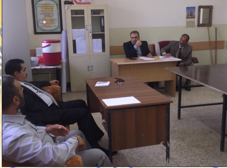
صور أثناء مناقشة أساتذة القسم بحوث التخرج لطلبة المرحلة الرابعة