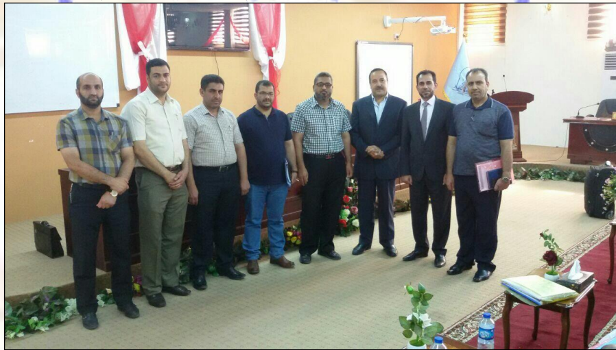
صور لاجتماع لأساتذة