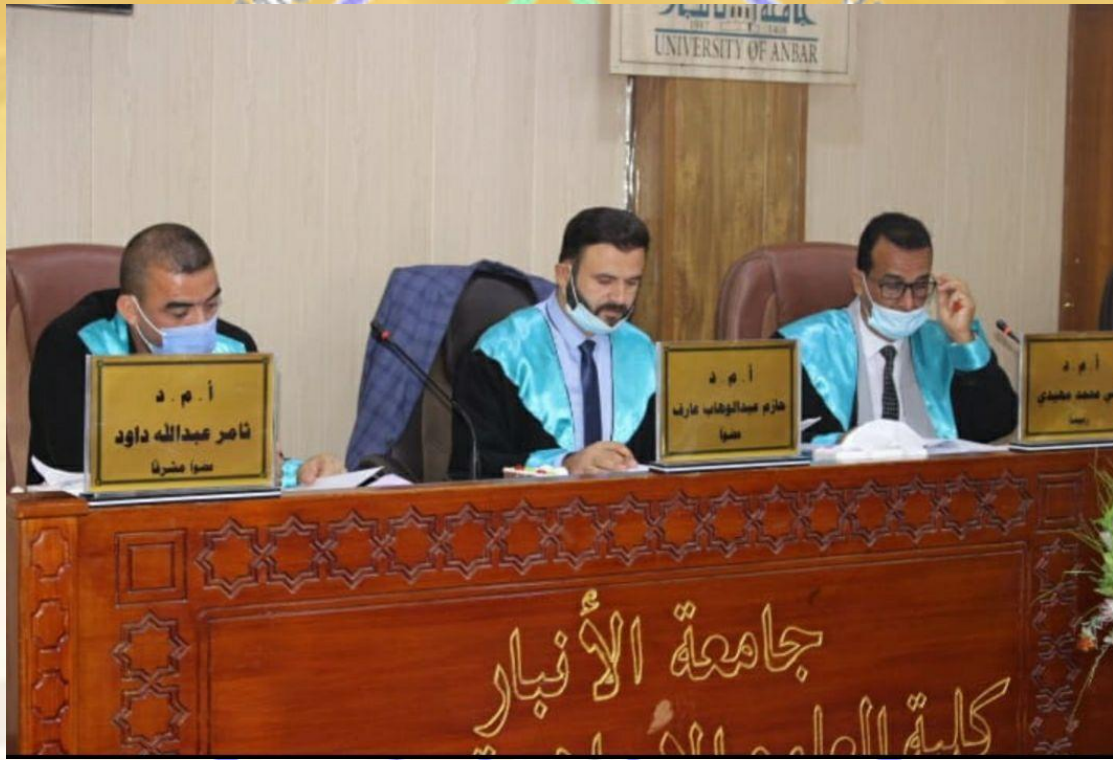
لقاء السيد رئيس القسم مع طلبة قسم الحديث